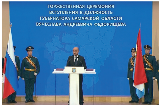
ТОРЖЕСТВЕННАЯ ЦЕРЕМОНИЯ ВСТУПЛЕНИЯ В ДОЛЖНОСТЬ ГУБЕРНАТОРА САМАРСКОЙ ОБЛАСТИ ВЯЧЕСЛАВА АНДРЕЕВИЧА ФЕДОРИЩЕВА

На выборах Губернатора, а они проходили 6, 7 и 8 сентября 2024 года, Вячеслав Андреевич получил колоссальную поддержку избирателей, свои голоса в пользу действующего главы региона отдали более миллиона человек. Это говорит о том, что твердая позиция избранного Губернатора, его стиль управления и подход к работе близки и понятны людям.